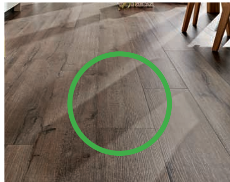
Silent Touch DD 300 AquaSafe -Spezialplatte: Reagiert nicht auf Wärme oder Sonneneinstrahlung