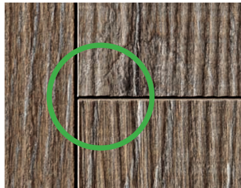
Silent Touch DD 300 AquaSafe -Spezialplatte mit sicherer Klick-Verbindung und geschlossener Fuge