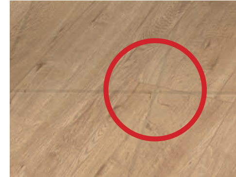
Herkömmlicher Vinylboden: Altuntergründe können sich abzeichnen