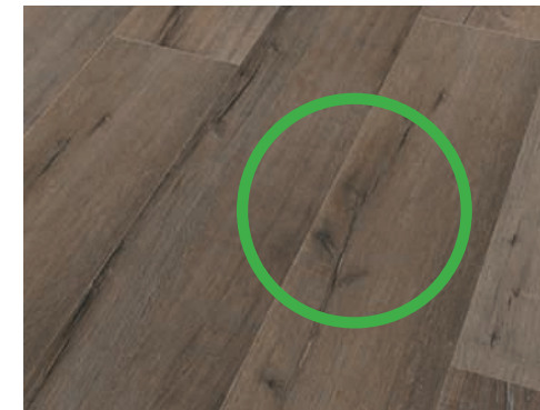
Silent Touch DD 300 AquaSafe -Spezialplatte: Kein Abzeichnen von Altuntergründen