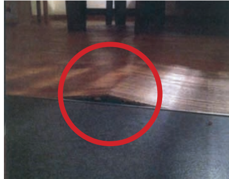
Herkömmlicher Vinylboden: Thermoplastischer Kern dehnt sich durch Sonneneinstrahlung aus und kann bei Wärme an der Oberfläche »Beulen« werfen