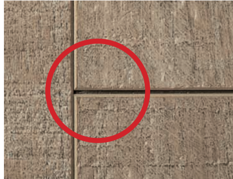
Herkömmlicher Vinylboden mit thermoplastischem Kern und offener Fuge