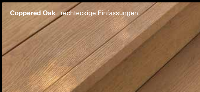
Coppered Oak | rechteckige Einfassungen