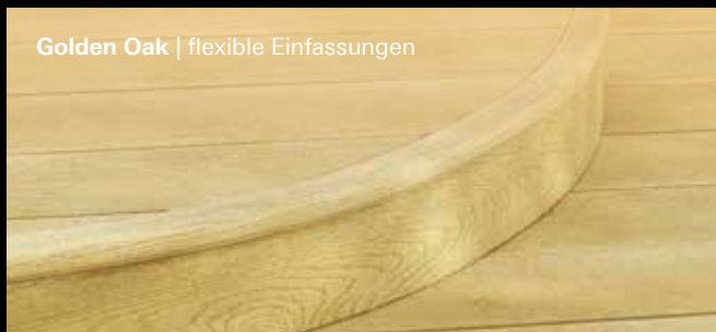
Golden Oak | flexible Einfassungen