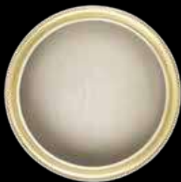
Smoked Oak / Driftwood