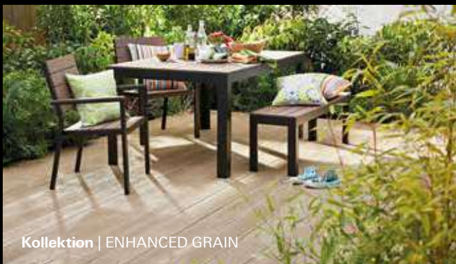
Kollektion | ENHANCED GRAIN

Handmodelliert nach Echtholz-Mustern: Dielen-Unikate von verblüffend natürlicher Anmutung.