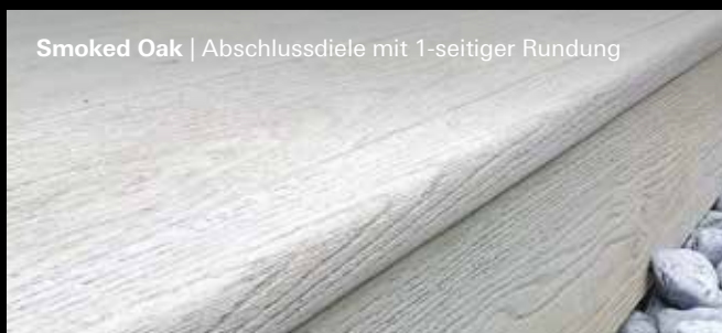
Smoked Oak | Abschlussdiele mit 1-seitiger Rundung

Komplettieren Sie den Millboard-Look mit unseren Einfassungen.