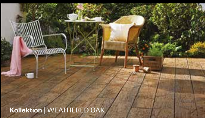
Kollektion | WEATHERED OAK

Die einzigartige Lastane®-Oberfläche des Werkstoffs ist nahezu wartungsfrei und äußerst pflegeleicht. Instandhaltungsarbeiten wie Schleifen o.Ä. entfallen. Gelegentliches Wischen mit Wasser und mildem Reinigungsmittel genügt. Eine splitterfreie, rutschfeste Allwetter-Diele, die sich in privaten wie öffentlichen und gewerblichen Bereichen bewährt.