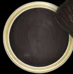
Charred / Emberred