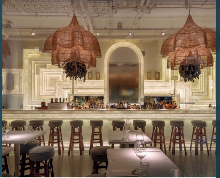
HIMACS Ispani M428, The Paradise Now, Düsseldorf By Moritz von Schrötter, Charles Bals, Walid El Snehkh